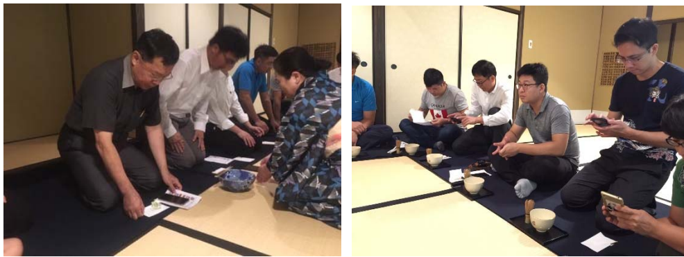
堺利晶之社日本茶道體驗

本項參訪規劃主要在以茶道文化體驗為主，堺利晶之社展示了日本茶聖「千利休」對日本茶文化的影響，更透過「與謝野晶子」詩歌創作的起點，來闡述日本茶道「立禮呈茶」。在「堺利晶之社」紀念館裡，珍藏著包含兩位堺市名人「千利休」和「與謝野晶子」的生平事蹟以及各種影像、展品及遺址石碑，足足說明他們對日本茶道和文學作出的貢獻。 因應工藝中心未來成立國際工藝茶學院，透過本次體驗參訪，了解日本民間非營利組織團體在經營無形文化的推動模式，將有機會作為推動茶文化之參考作為，並用作鼓勵國內民間相關團體。