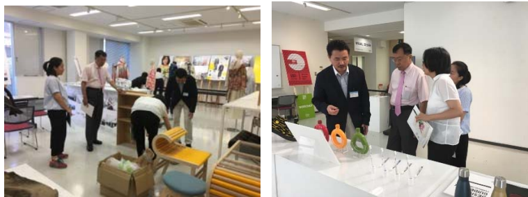
工藝中心主任參訪大阪成蹊大學藝術部學生工坊及作品