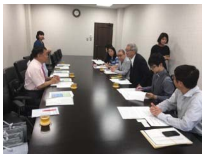
大阪成蹊大學與工藝中心雙方與會

學生交流部分,日本校方表示,因日本學生較有經濟上的考量,比較無法實際進行學生的交換,另則,因工藝中心非屬教育系統,學生交換無法提供學分成績,對於日本學生而言,會有較多的困難。但若以雙方師資進行交流,則是相當樂觀其成的。