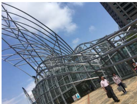
國立國際美術館主要建築體

這座新建築的設計靈感是源於旺盛的長青竹子，它是由號稱世界十大最具影響力的建築師之一的「西薩佩里」所設計，該大阪國立國際美術館的主體結構有相當一部份外觀是由地面伸延到半空，以以鈦塗層不銹鋼管為主建物，透過密封鋼管可作任意移動 10 至 15 厘米，博物館共三層和地下層，第一層是公共聚會活動空間，餘下兩層作為臨時和常設展區，三層展區都有自然採光，展品主要以當代藝術為主，它同時收藏了畢加索、塞藏奴、佐伯佑三等著名畫家的作品，而且也收藏了一系列世界優秀的現代美術作品，其中有版畫、有雕刻品、有繪畫作品等總共大約 2700 件以上。