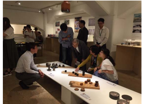
日本大阪成蹊大學校長展場作品導覽