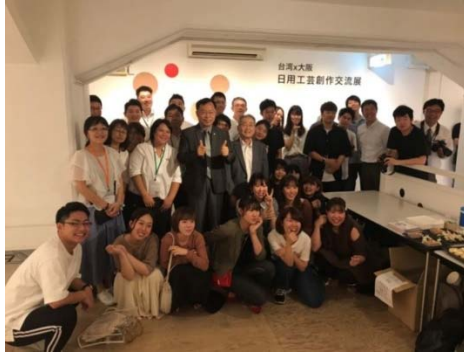
開幕參展全體人員合影