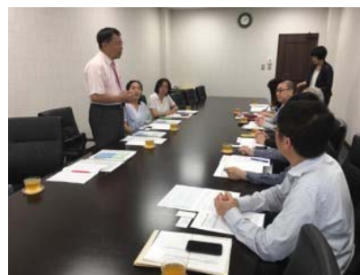
工藝中心主任說明與會目的