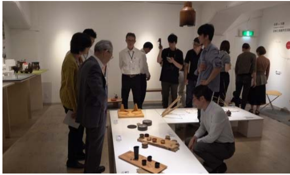
日本大阪成蹊大學校長展場作品導覽